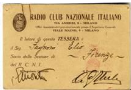
***tessera 1 fagnoni *tessere di Elio Fagnoni