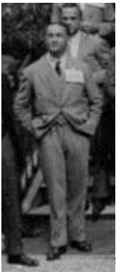
***montù *Ernesto Montù *

Fondato il 5 febb. 1924 da Montù, col nome Radio Club Italia, divenne prima Radio Club Nazionale (RCN), il 26 aprile 1924. Nel dicembre 1923 era iniziata la pubblicazione del "Radiogiornale" diretto da Montù che diviene organo ufficiale prima del RCL poi dell' RCN.