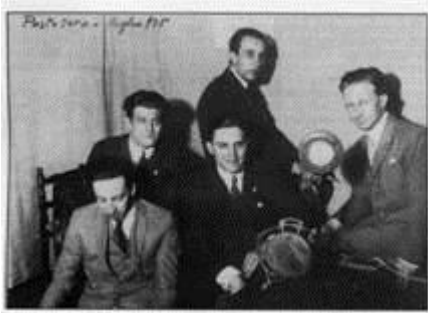
***postozeroognesutta *Gli artefici di Posto Zero*

Altri radio Club a Milano come il Radio Club Comense ed il Radio Club Varesino. Il Radio Club Fiorentino nel