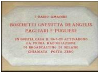
***radio15postozero*Targa commemorativa del Posto Zero

All'inizio del 1926 l'ADRI pubblicò un bollettino per proprio conto: