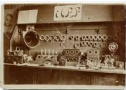
***fagnoni 5 1924 1 * Stazione di Elio Fagnoni al 1924 *